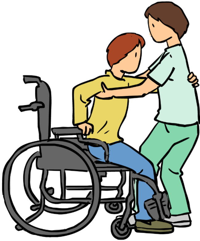
Silla de ruedas