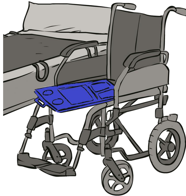
Tabla de transferencia